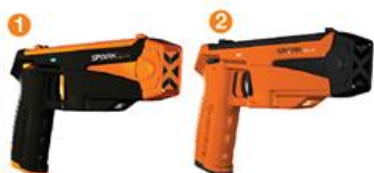
1. Spark DSK 700 2. Spark DSK 710