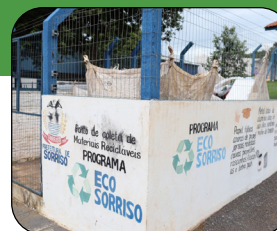
Escola Municipal Flor do Amanhã

Encaminhe os resíduos recicláveis aos ecopontos instalados no Município