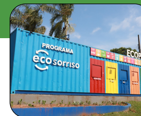
Praça da Integração (Novos Campos)