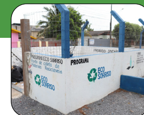
Cemeis Caminhos do Saber Jd. Primavera