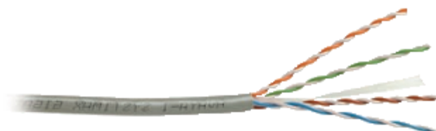
30050-Cabo de par trançado UTP.

O conector RJ-45 Fêmea deverá ser categoria 5, para rede local tipo ETHERNET com a taxa de transmissão de até 1 gigabit, aplicável em cabo sólido UTP 24 AWG, compatível com o espelho descrito no parágrafo anterior.