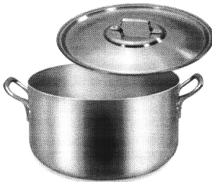
Caçarola Linha Hotel 45 - Eirilar