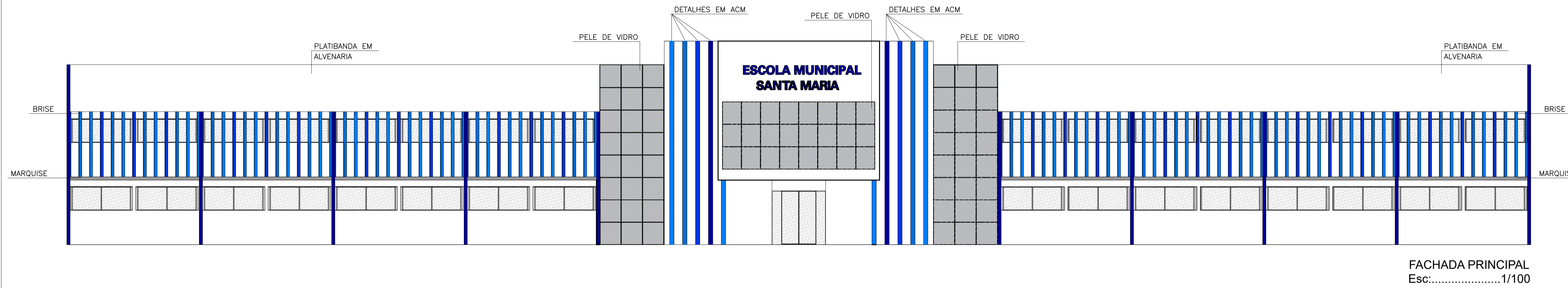
FACHADA PRINCIPAL Esc:.....1/100