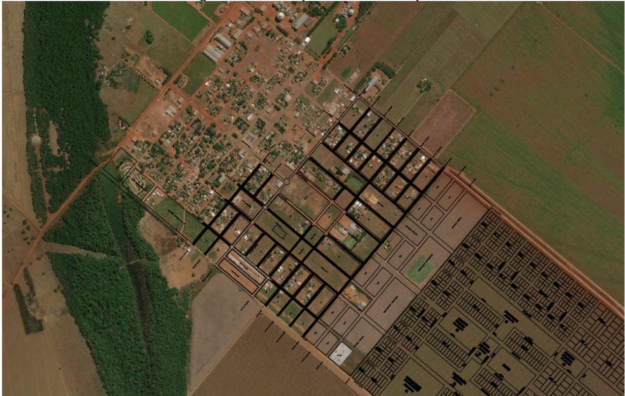
Figura 1 - Localização da Área de Projeto

Toda área a ser drenada foi devidamente levantada de forma planialtimétrica a fim de determinar a situação do local do terreno, como também as áreas de contribuição para determinação da drenagem.