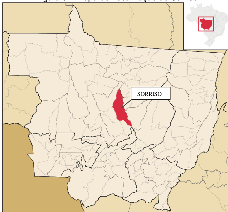
Figura 3 – Mapa de Localização de Sorriso