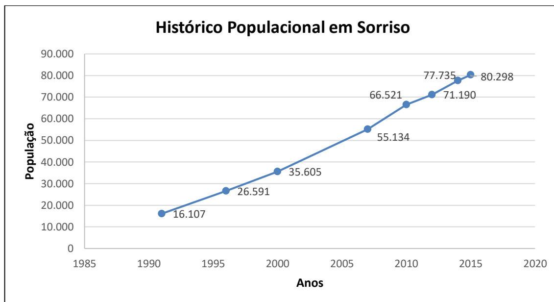
Figura 4 – Gráfico de Crescimento Populacional de Sorriso