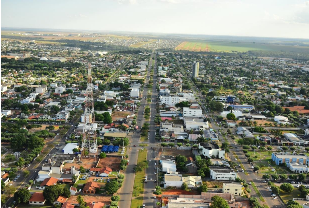
Figura 2 - Vista aérea da cidade de Sorriso.