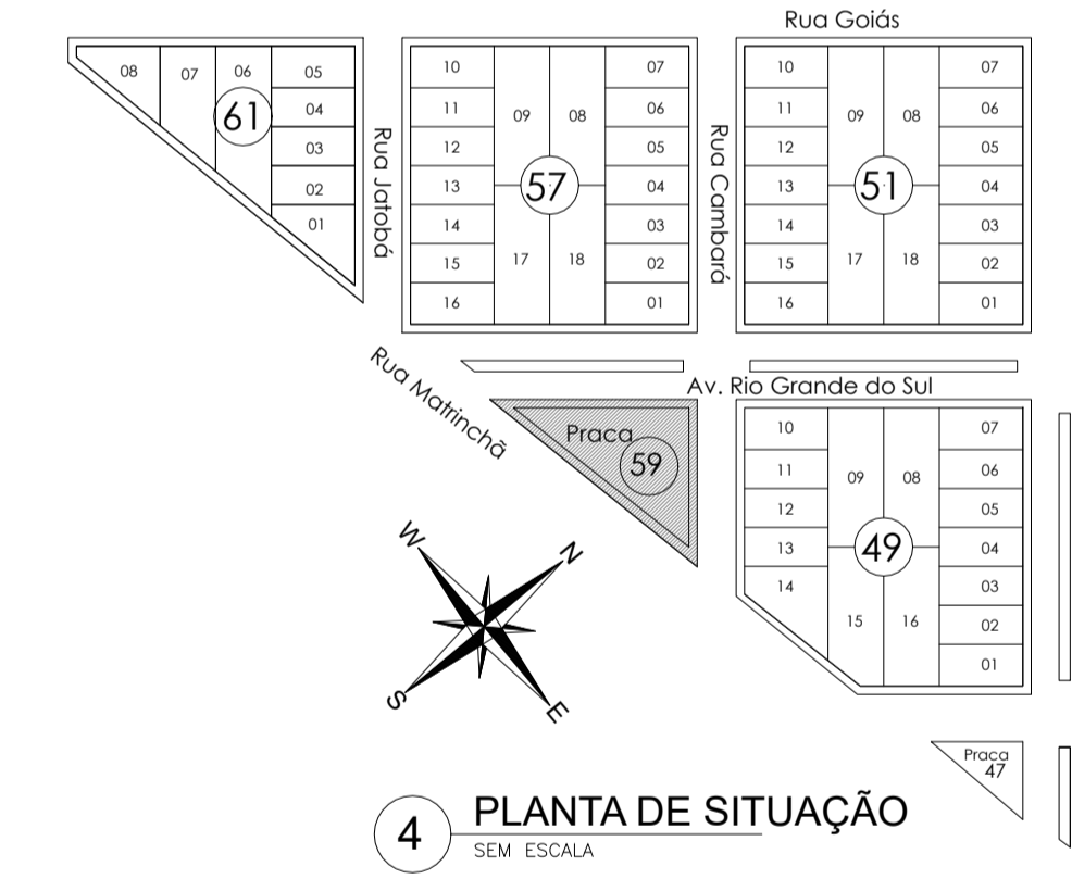
4 PLANTA DE SITUAÇÃO SEM ESCALA