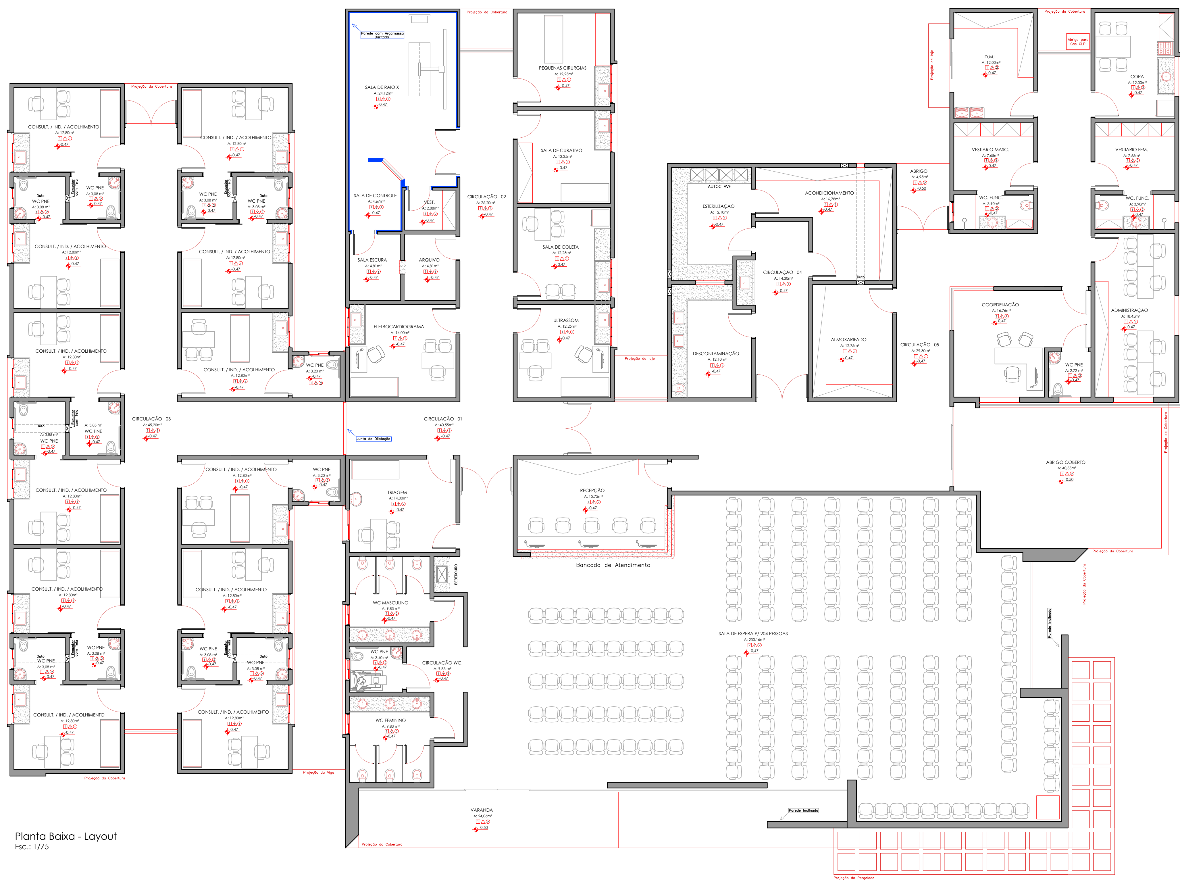
Planta Baixa - Layout Esc.: 1/75