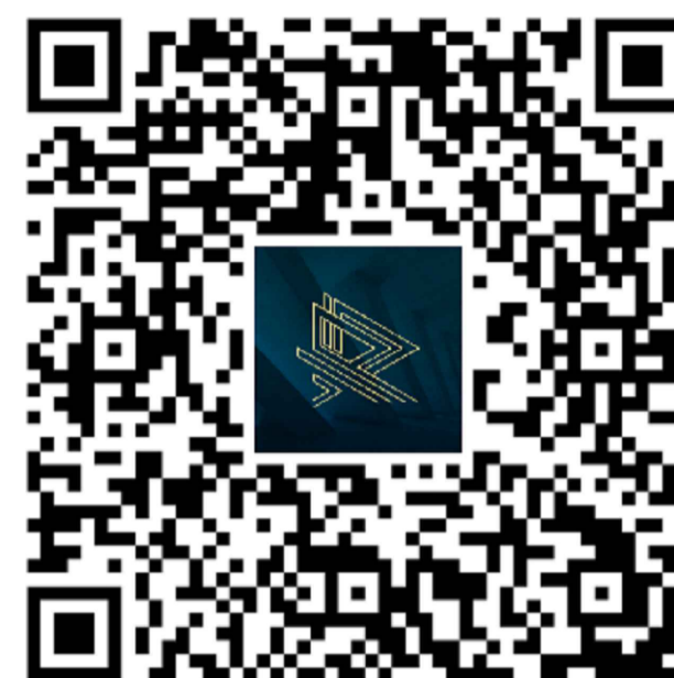
02 PROJETO DE CLIMATIZAÇÃO EM 3D COMPATIBILIZADO COM ESTRUTURA PARA VIZUALIZAR: CAMERA DO CELULAR OU APP LEITOR DE QR CODE