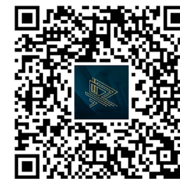
03 PROJETO DE HIDRÁULICO EM 3D COMPATIBILIZADO COM ESTRUTURA PARA VIZUALIZAR: CAMERA DO CELULAR OU APP LEITOR DE QR CODE