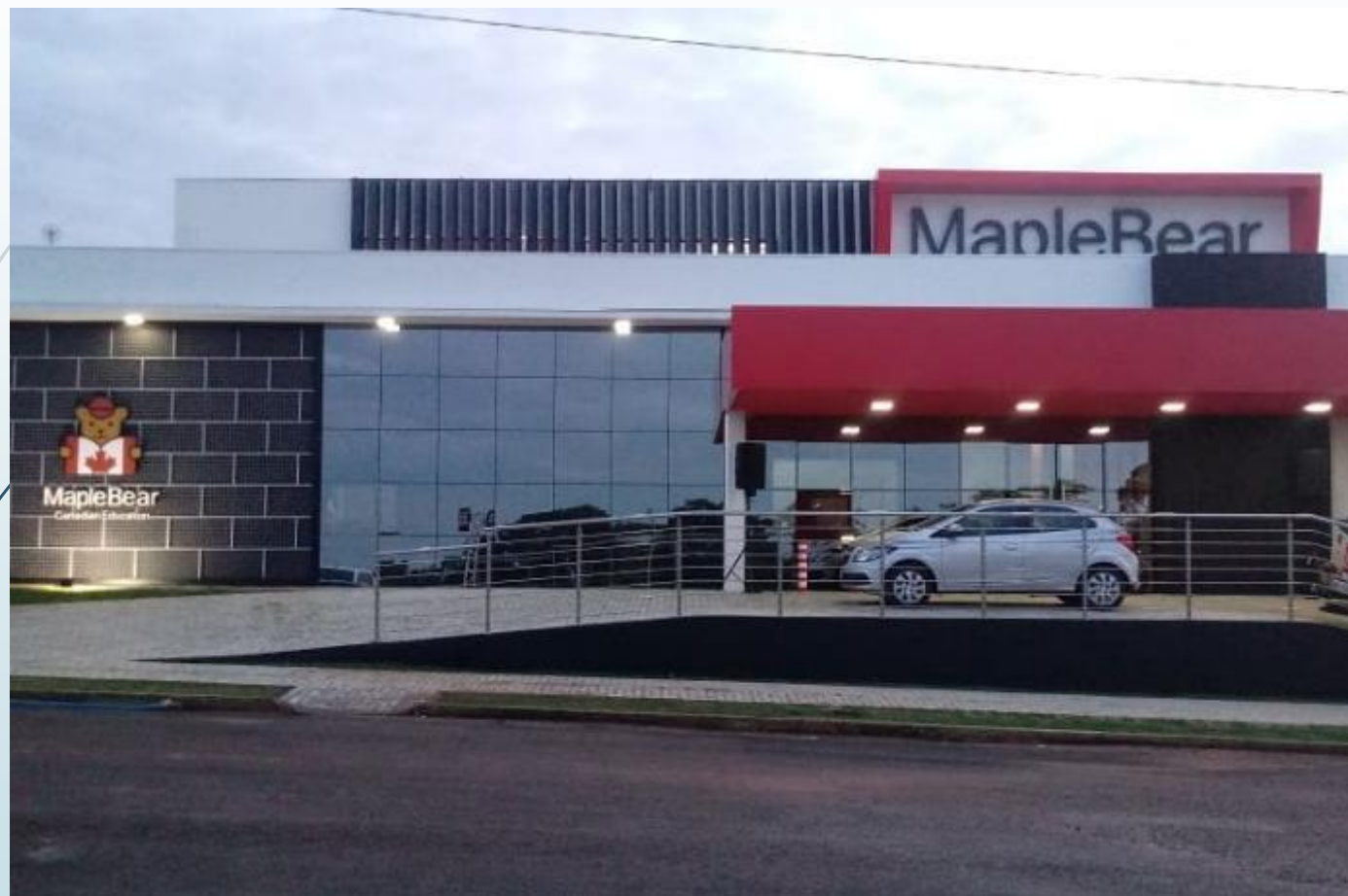
ESCOLA CANADENSE MAPLE BEAR