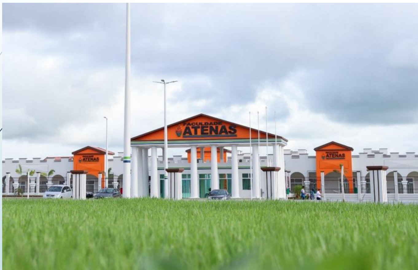
FACULDADE ATENAS DE MEDICINA