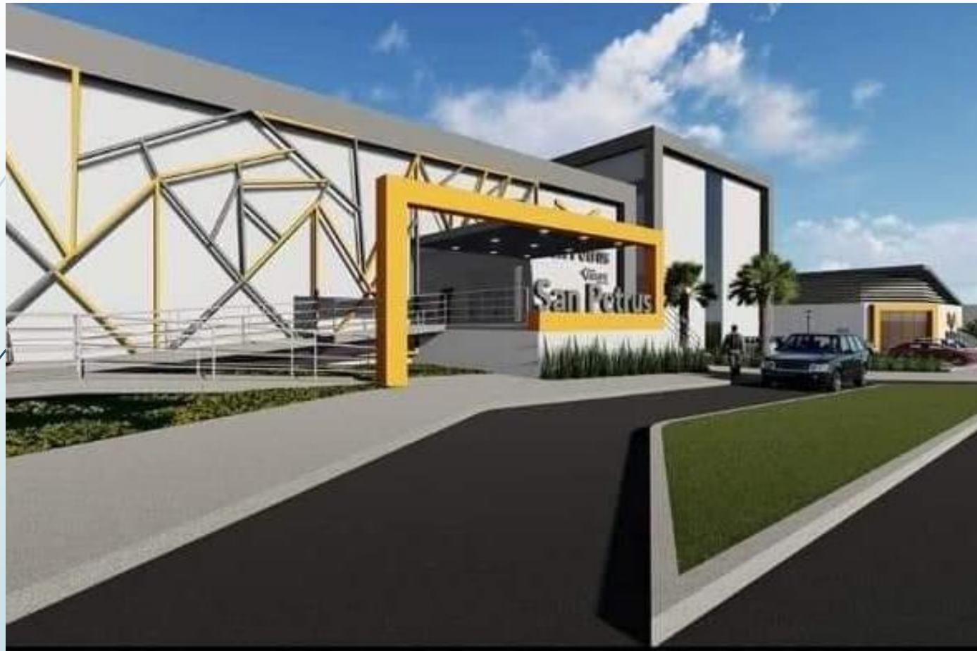
COLÉGIO SAN PETRUS