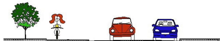
SECÇÃO TRANSVERSAL - Rua Lupicínio Rodrigues