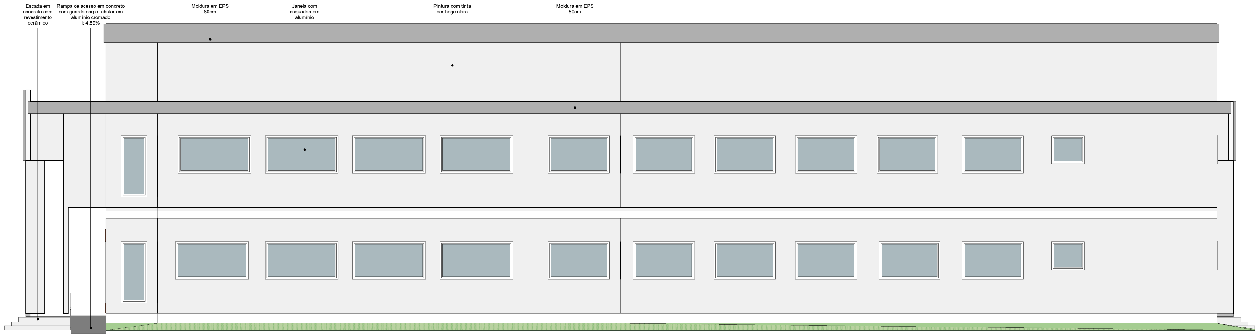
3 ELEVÇÃO LATERAL DIREITA I: 100